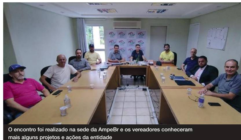
O encontro foi realizado na sede da AmpeBr e os vereadores conheceram mais alguns projetos e ações da entidade

“A visita foi muito positiva. Aproveitamos para trocar algumas ideias para projetos futuros e nos aproximarmos do poder Legislativo municipal. Agradecemos a visita dos vereadores e ficamos à disposição, da mesma forma, no que for possível contribuir”, comentou Schoening.