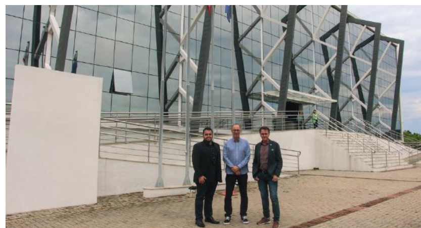
Os diretores da AmpeBr conheceram também Instituto SENAI de Sistemas Embarcados