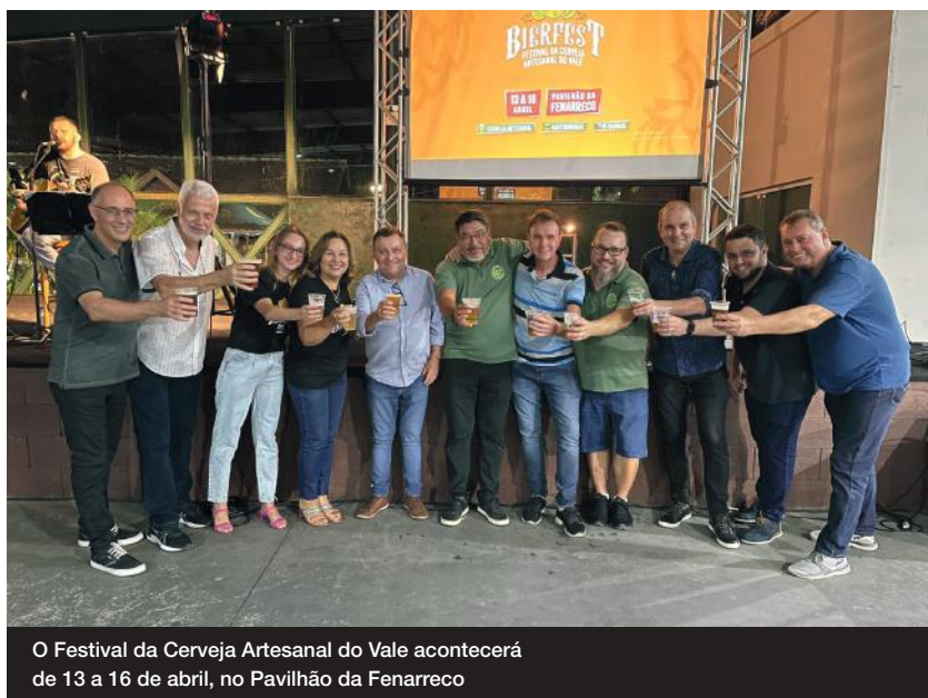
O Festival da Cerveja Artesanal do Vale acontecerá de 13 a 16 de abril, no Pavilhão da Fenarreco